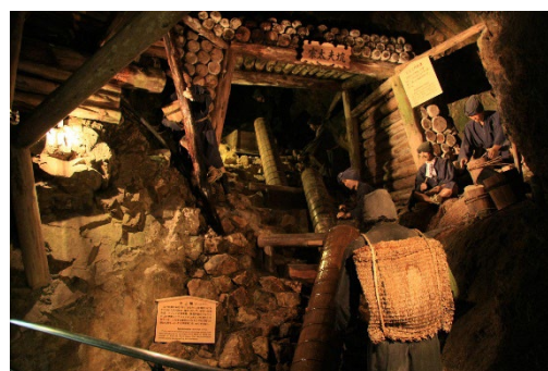
佐渡金山（宗太夫坑）

新潟港（07:55）～ジェットフォイル～（09:02 着）両津港＝トキの森公園（見学）＝尾畑酒造（買物/試飲）＝佐渡歴史伝説館（昼食/見学）＝北沢浮遊選鉱場跡（見学）＝史跡・佐渡金山（宗太夫坑または道遊坑）＝めおと岩ドライブイン（買物/「佐渡の塩」お土産）＝両津港（16:05）～カーフェリー2等～（18:35 着）新潟港